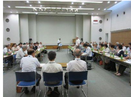
岡崎市福祉会館ホール （西成38名 矢作南19名）