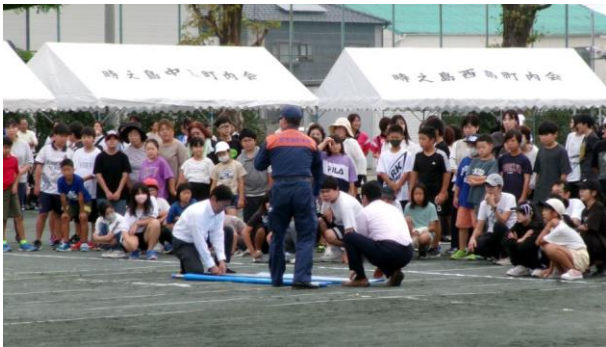
簡易担架の組立体験

競技の合間に備蓄品倉庫の見学、ダンボールベットの体験等を行い、有事の際への対応を学びました。