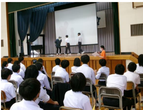
生徒も参加した寸劇

屋内運動場に集合したのち、「認知症の症状、行動等」の講座、「帰り道がわからなくなった、おばあちゃん」「財布を無くした、おばあちゃん」への対応方法について寸劇と参加者間での意見交換、「認知症予防運動(頭を使いながら、声を出しながらの運動)」の体験を行い、認知症についての理解が深まった有意義な講座になりました。