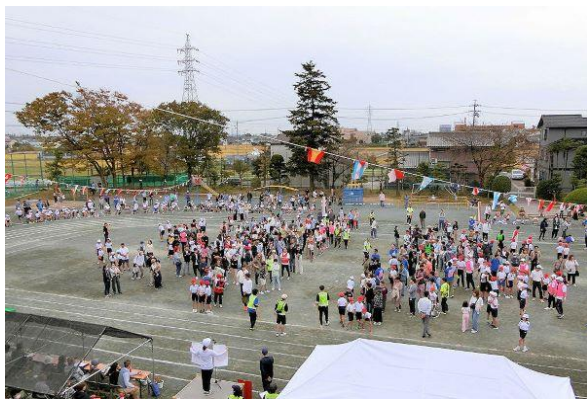
<10/26 赤見校区> ○×クイズ