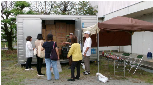
備蓄品倉庫の見学