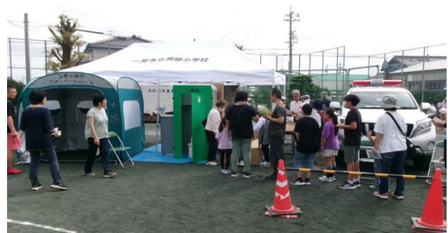
仮設トイレ等防災展示エリア