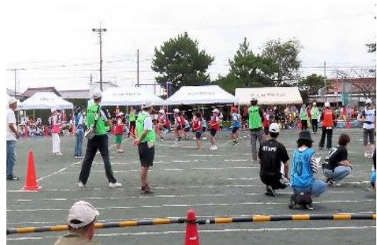
<10/6 西成校区> 大縄跳び