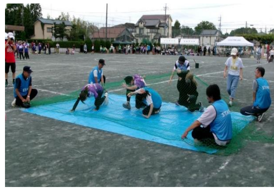
<9/29 浅野校区> 障害物競争