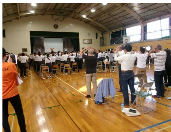
全員で認知症予防運動