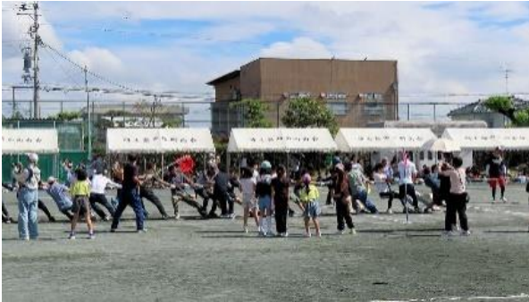
<10/6 瀬部校区> 綱引き